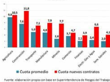
Gráfico 1. Cuota promedio y cuota de los nuevos contratos en el sistema de las ART Marzo, 2016

Uno de los temas que más preocupa a las empresas es el elevado costo que tiene la contratación de una aseguradora de riesgos del trabajo (ART) a fin de prevenir y tener cobertura ante accidentes de trabajo y enfermedades profesionales. La alcúota promedio del costo de una ART está en 3,3% de la masa salarial, con variaciones según la actividad.